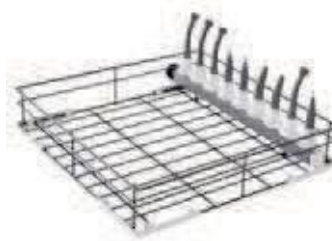
KORG FÖR 9 HANDSTYCKEN