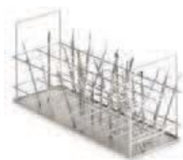
INSATS FÖR VERTIKALA INSTRUMENT